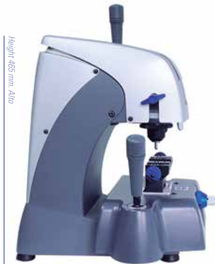
Height 465 mm. Alto