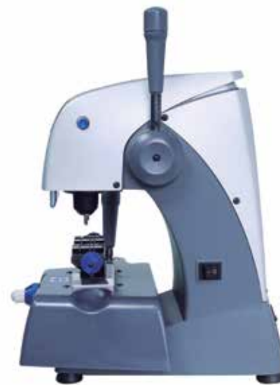
Depth 385 mm. Profundidad