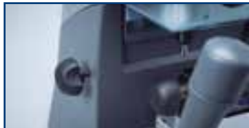
5 Vertical axis locking